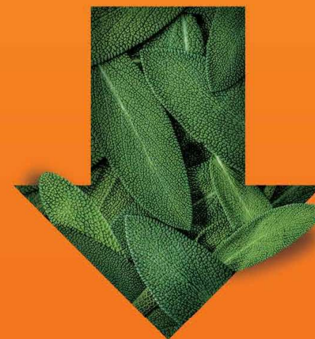
צמצום טביעת הרגל שלנו